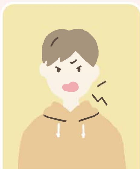
怒りやすくなった